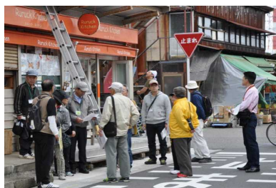
沼垂テラスを散策