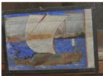
乙子神社 奉納船絵馬