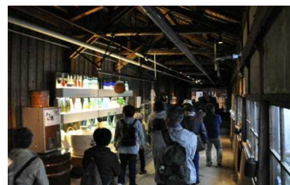
現在の沼垂（醸造の町）も見学

東地区総合庁舎をスタートし、最初に訪れたのは、栗の木バイパスの脇に設置された「沼垂定住三百年記念の碑」でした。