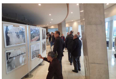
パネル展 イメージ