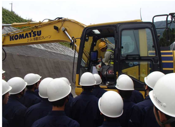
MGバックホウの見学(前回の状況)