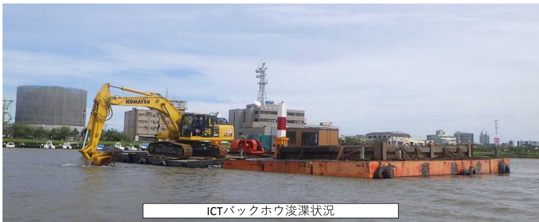
ICTバックホウ浚渫状況