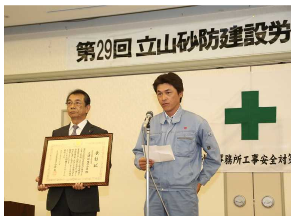
安全管理優良受注者紹介