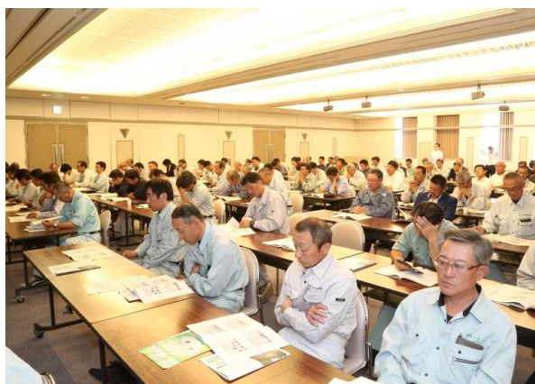
会場状況(会員席側)