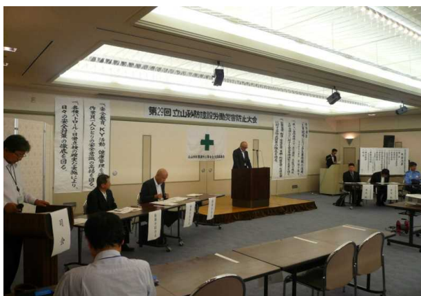
会場状況(ひな壇側)