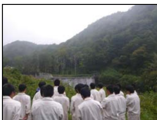
砂防堰堤見学状況