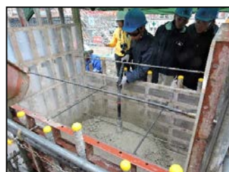
コンクリート締固め体験