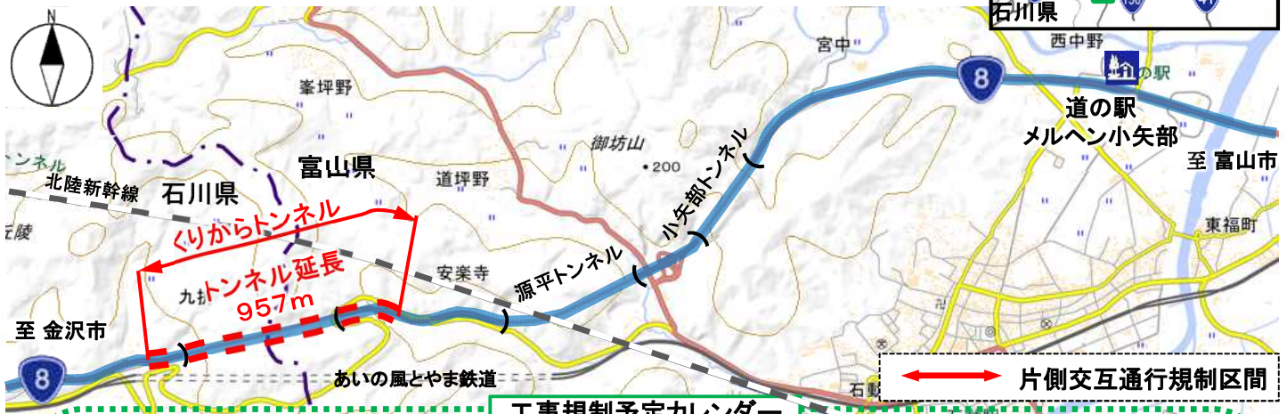
工事規制予定カレンダー