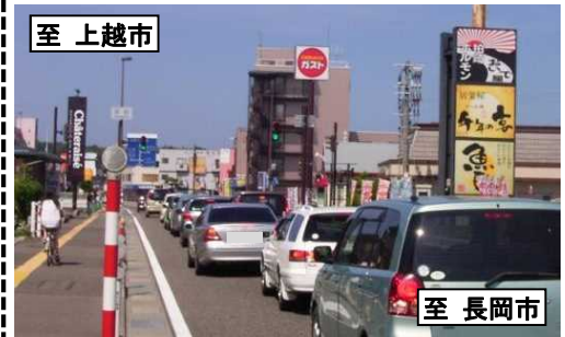
国道8号の混雑状況