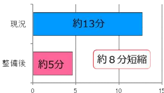
新潟中条中核工業団地から 東京方面へのアクセス時間