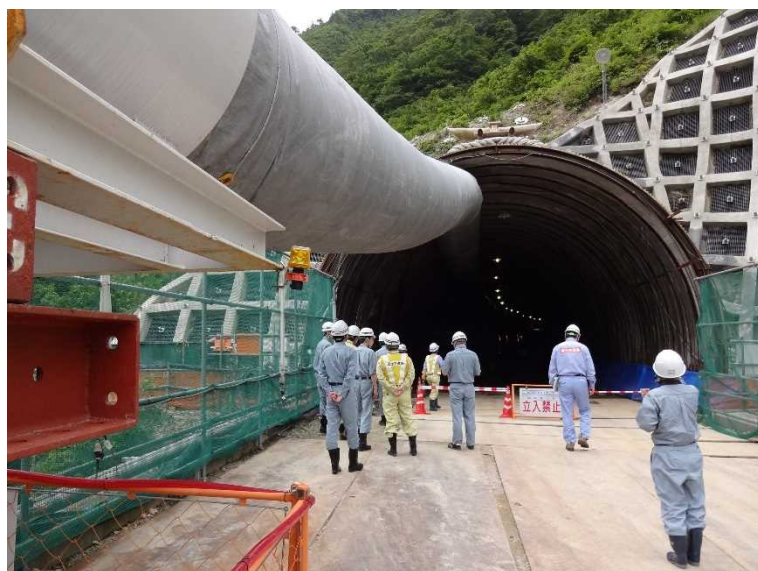
1号トンネル坑口(新潟側) H30. 5撮影