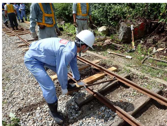
砂防工事現場体験3 (枕木交換体験)