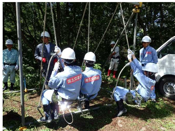
砂防工事現場体験2 (ロープ作業体験)