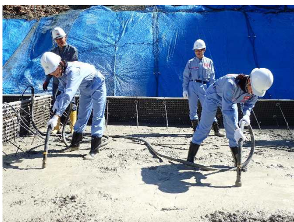
砂防工事現場体験1 (コンクリート打設体験)