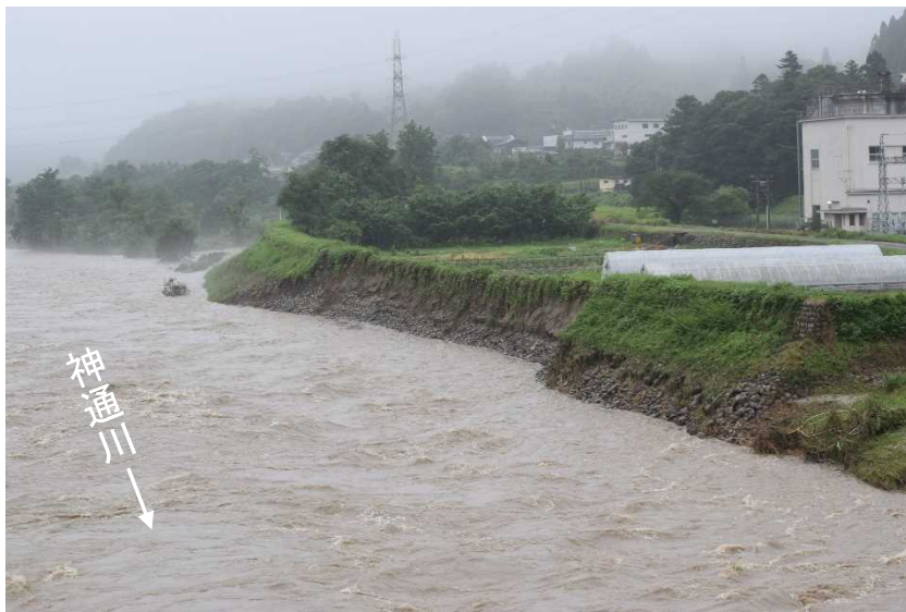
被災状況 (平成30年7月6日 11時00分)