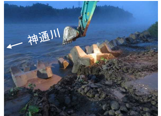
ブロック投入状況 (平成30年7月7日 19時頃)