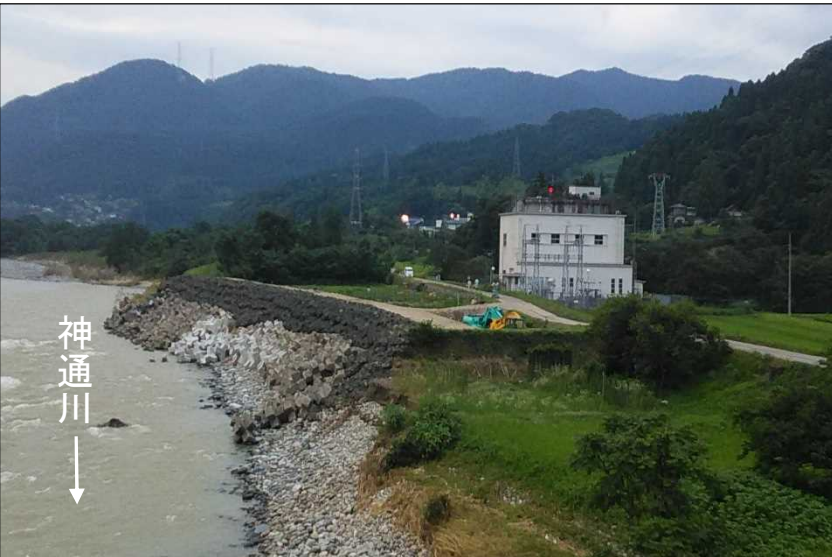
復旧が完了した堤防 (平成30年7月11日 18時30分)