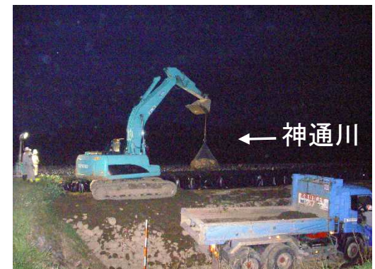
袋詰玉石設置状況 (平成30年7月10日 20時頃)