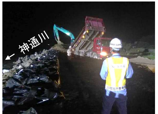
堤防復旧盛土施工状況 (平成30年7月9日 21時頃)