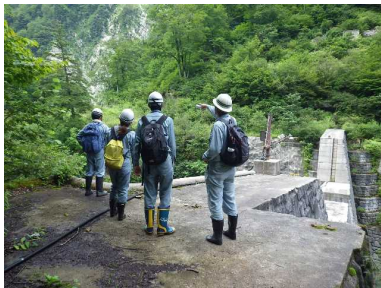
砂防現場見学イメージ