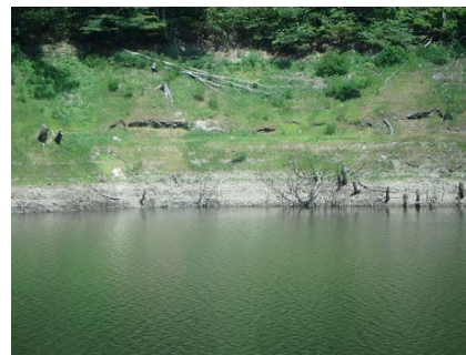
横川ダムの状況（8月3日9時現在）