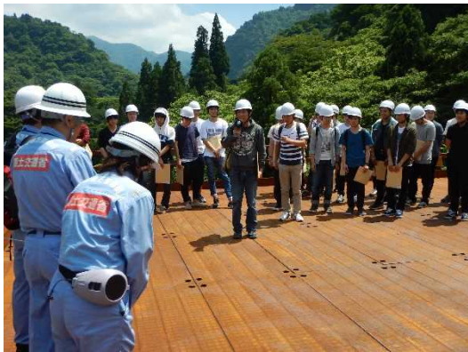
H29.7 見学会状況(代表生徒による挨拶)