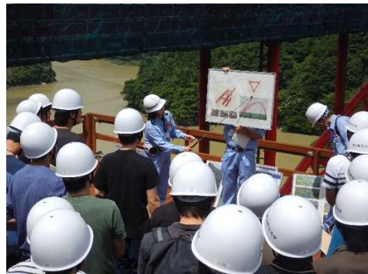
H29.7 見学会状況(工事概要説明)