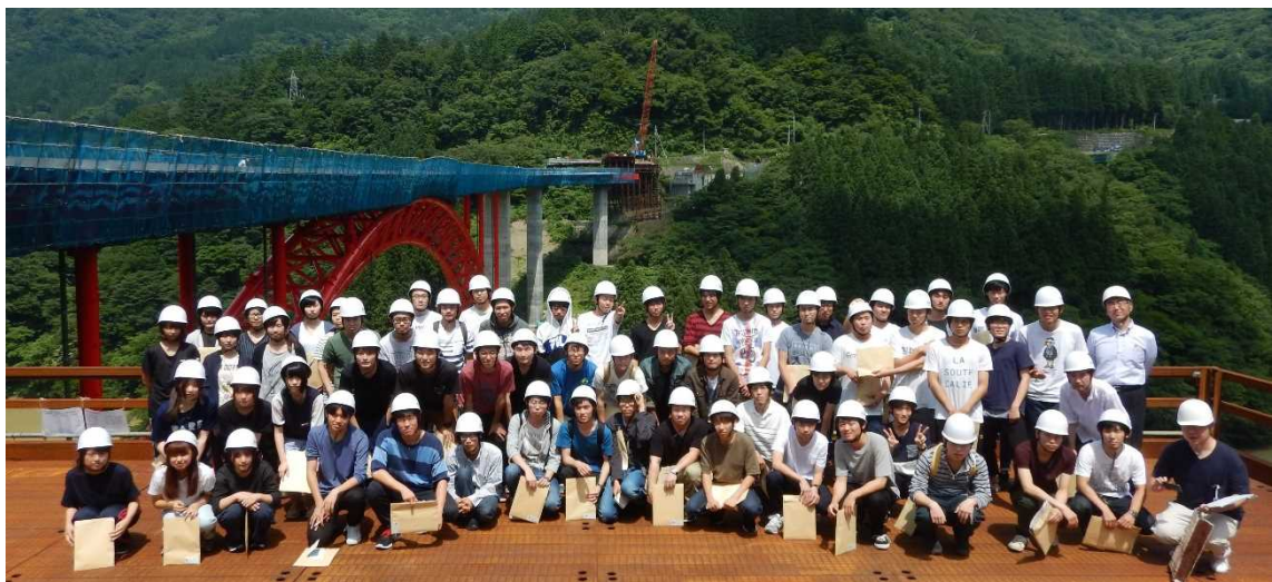
H29.7 見学会状況(集合写真)