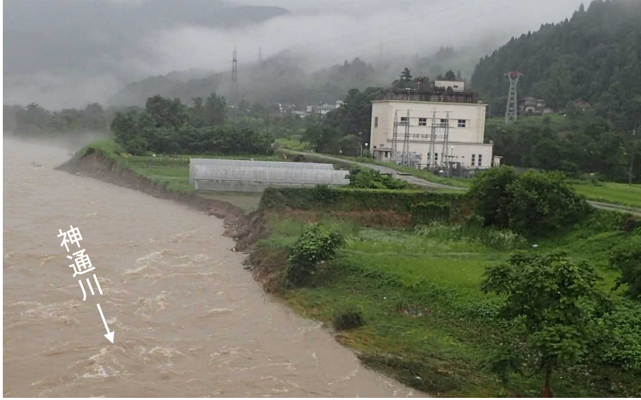
被災状況（平成30年7月7日 7時00分）