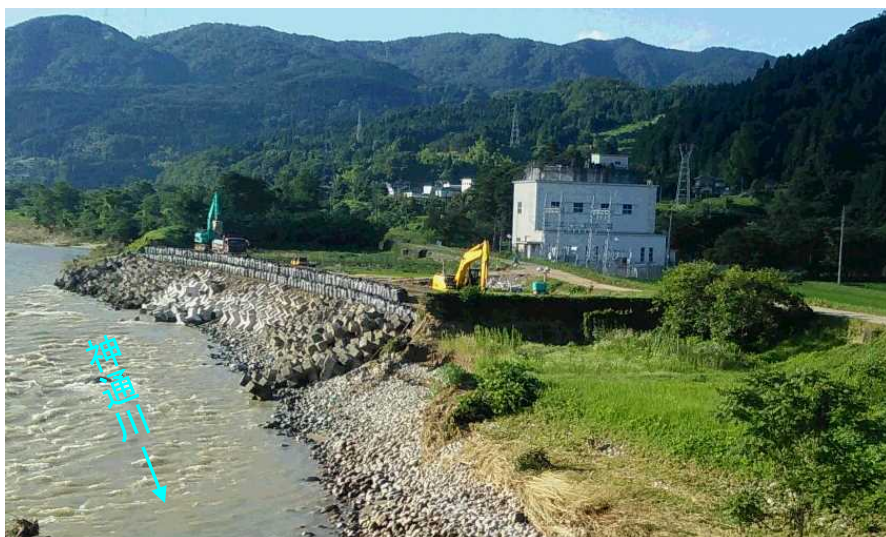
復旧状況（平成30年7月10日 7時00分）