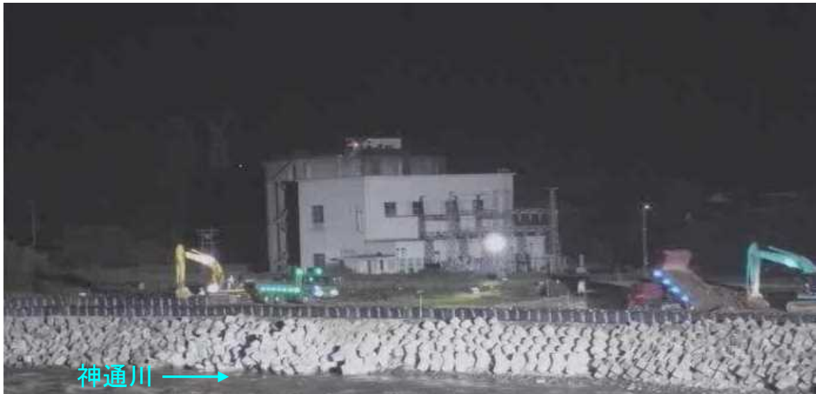
夜間作業状況（平成30年7月10日 00時57分）