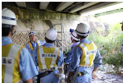
昨年度の実施状況