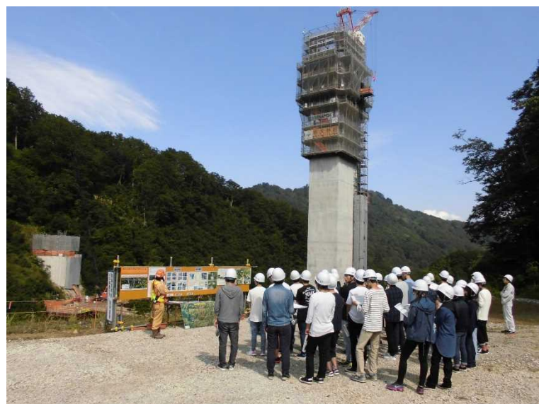
5号橋梁 P1・P2橋脚 H29. 9撮影