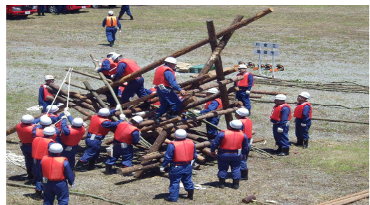
【平成29年度実施状況（川倉工）】