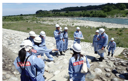
平成29年度の実施状況