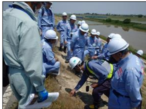
堤防法面裸地部の点検