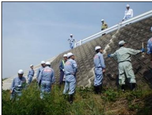
橋梁取付護岸の点検