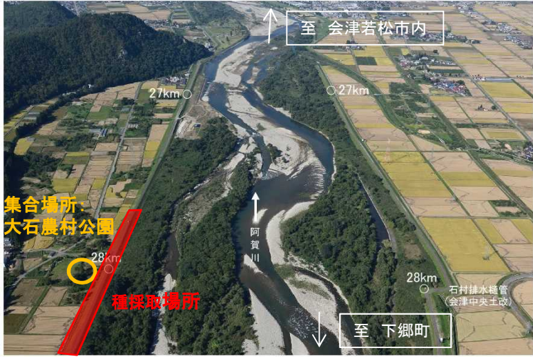
70 阿賀川 距離標 28km 下流向き