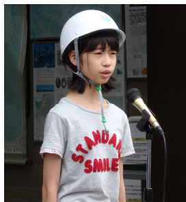
小学校児童応援の言葉