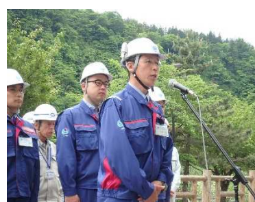
水谷出張所長宣誓