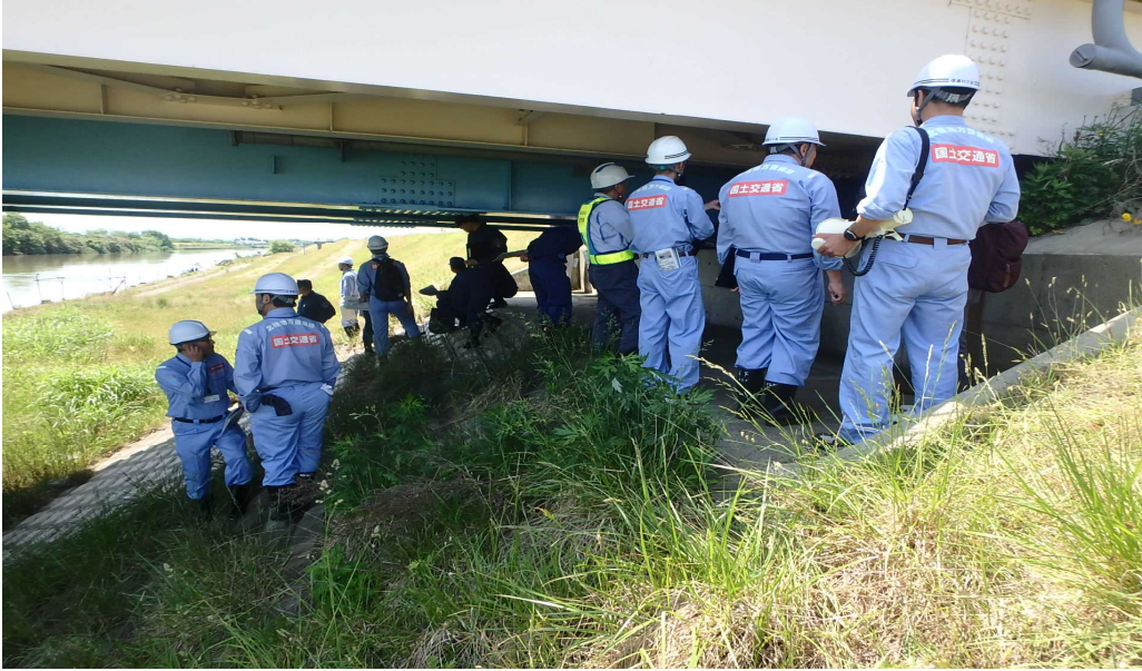
信濃川大橋 (堤防低部の点検)