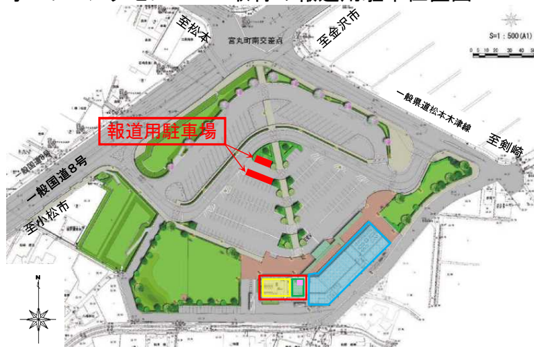
オープニングセレモニー取材の報道用駐車位置図

※報道関係車両は一般県道松本木津線の入口を使って報道用駐車場に駐車をお願いします。