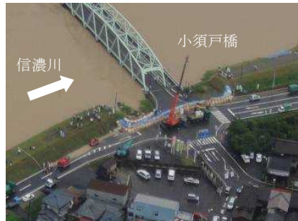
水防活動状況(H23.7 出水)