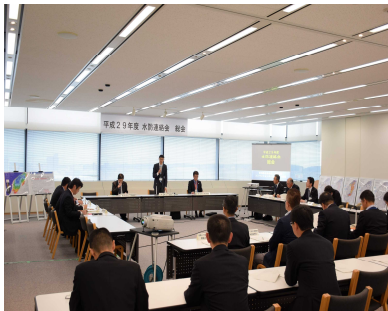
昨年度の水防連絡会総会