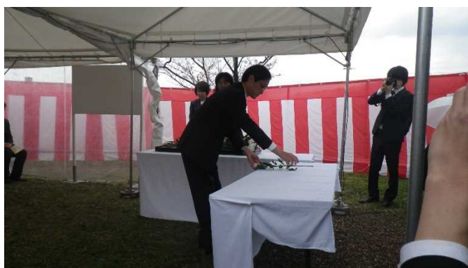
昨年度の実施状況

現在は、その後の信濃川補修工事及び大河津分水完工後の維持管理工事等を行う上で殉職された16名（昭和40年度が最終）の方を含め、100名の方のお名前が石碑に刻印されています。