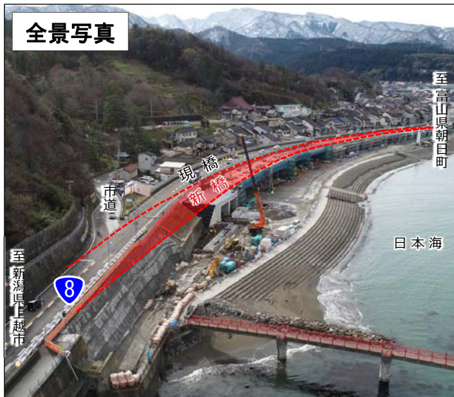
弁天大橋周辺状況(平成30年12月撮影)