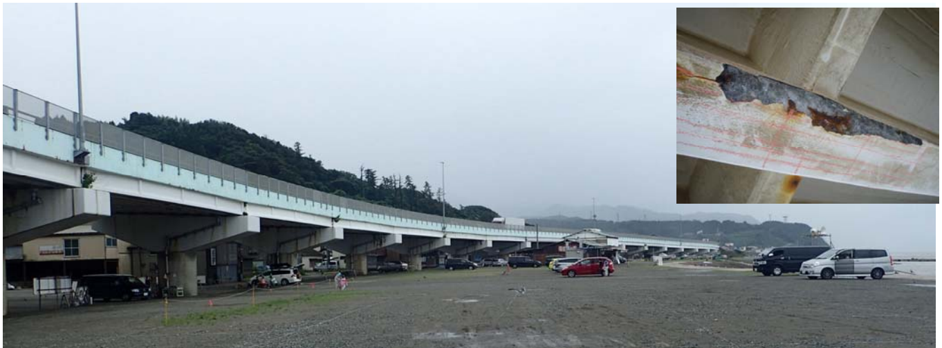
撤去する弁天大橋（H28撮影）と主な損傷状況