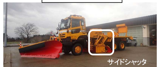
除雪機械（除雪トラック）