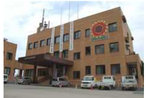
長岡市山古志支所