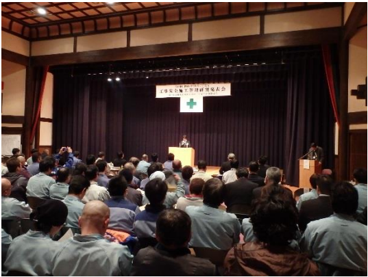
▲昨年度の論文発表状況