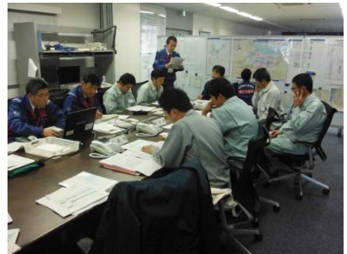
【平成28年度の訓練状況】

富山県、富山市、高岡市、射水市、朝日町、魚津市、小矢部市、中日本高速道路株、富山県警察本部、富山河川国道事務所