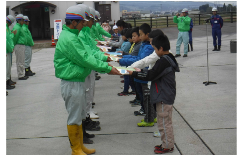
平成28年度 除雪出動式の状況

除雪出動式では、南魚沼市立上関小学校3年生から除雪作業受注者へ応援メッセージ鍵贈呈、激励のこたばを頂きます。除雪出動式終了後、除雪機械の試乗などの体験学習に参加して頂きます。