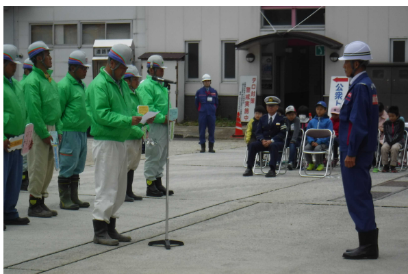
平成28年度 除雪出動式の状況