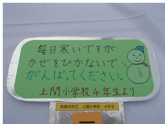
平成28年度の応援メッセージ鍵の例