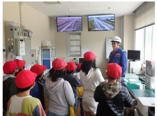
村上道路ステーションの見学(体験学習会)