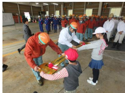
小学生からの鍵引渡し