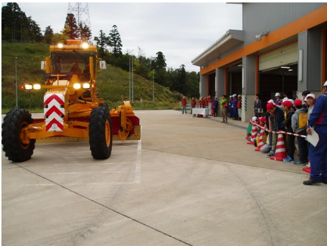
除雪機械デモンストレーション(除雪出動式)