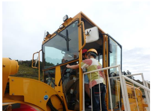
除雪機械への搭乗体験(体験学習会)