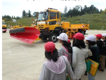
除雪機械デモンストレーション