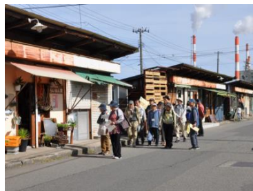
石井小路（沼垂テラス）を散策