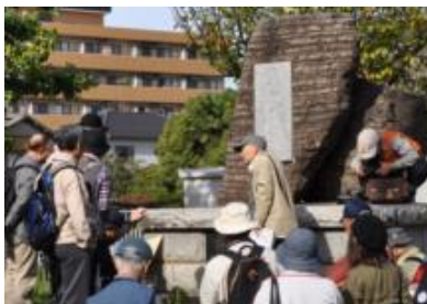
沼垂定住三百年記念の碑を訪ねました。