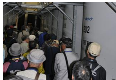
現在の沼垂（醸造の町、酒蔵）も見学

最初に栗の木バイパスの脇に設置された「沼垂定住三百年記念の碑」を訪れました。日和に恵まれ、参加者の足の運びも順調でした。