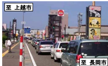
国道8号の混雑状況