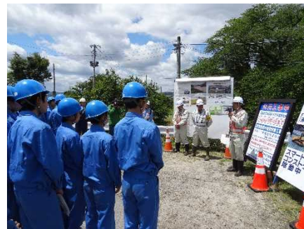
昨年 の見学会 の状況 写真

【お問い合わせ先】 一般社団法人福島県建設業協会 電話：024-521-0244