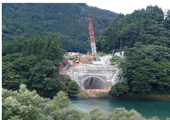
工事の状況(対岸から撮影)