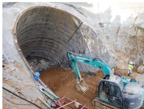
橋脚基礎工「斜め深礎杭」の施工状況