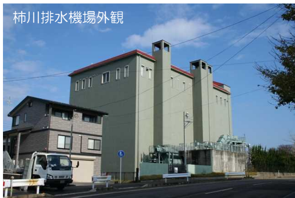
柿川排水機場外観

※排水機場内に駐車スペースを確保しておりますが、台数に限りがありますので、できるだけ公共交通機関等をご利用ください。