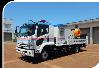
照明車、排水ポンプ車