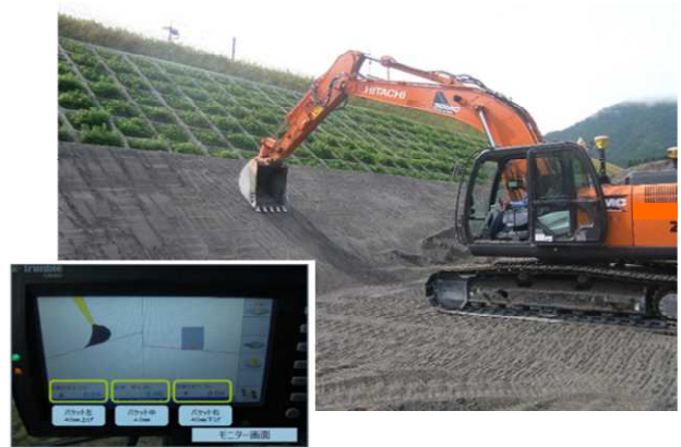
ICTを活用した土工工事の施工状況