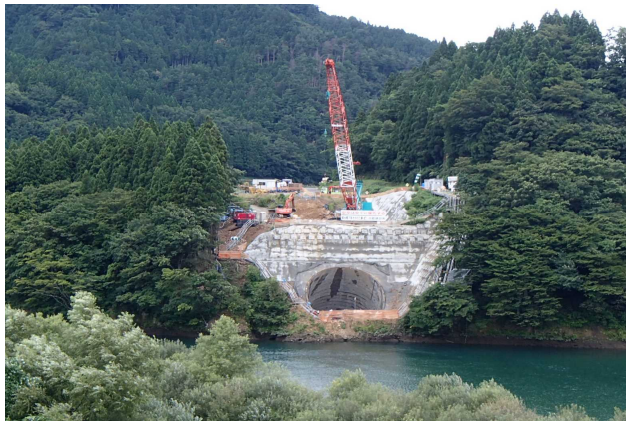
斜め深礎杭の施工状況（対岸から撮影）