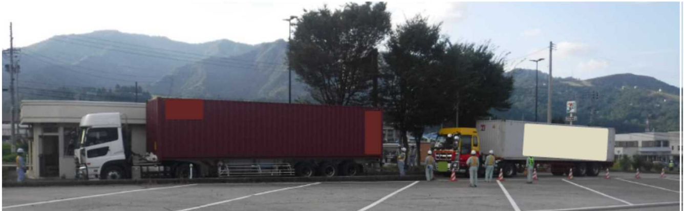
塩沢道路ステーション車両引き込み状況