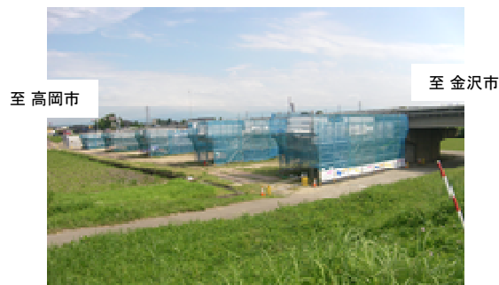
茅焔橋橋梁工事施工状況(右岸側)