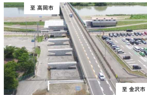
茅焔橋橋梁工事施工状況(左岸側)