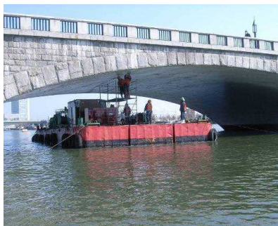
台船による点検(イメージ)