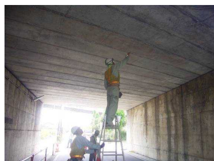
梯子による点検(イメージ)