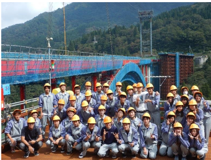
庄川橋梁 (全体写真)