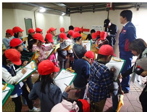
平成28年度実施状況