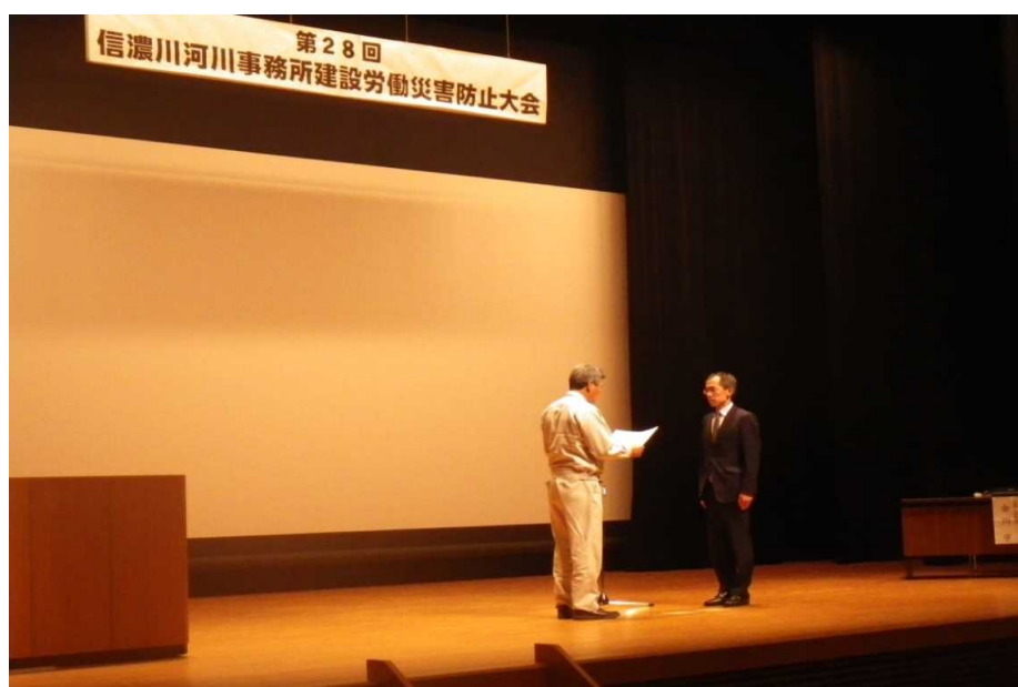
～ 昨年度 建設労働災害防止大会の様子 ～