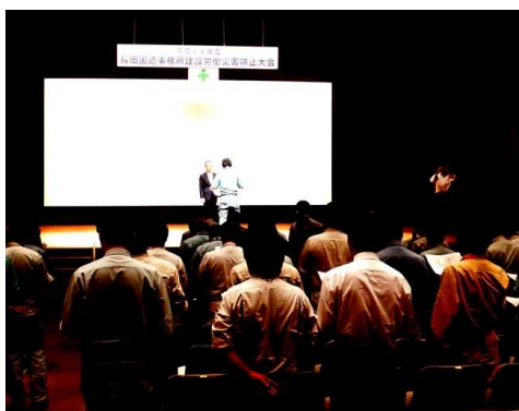
昨年度の建設労働災害防止大会