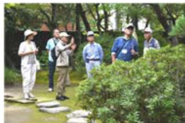
歴史的建造物を探訪