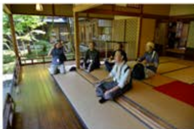
旧齋藤家別邸見学