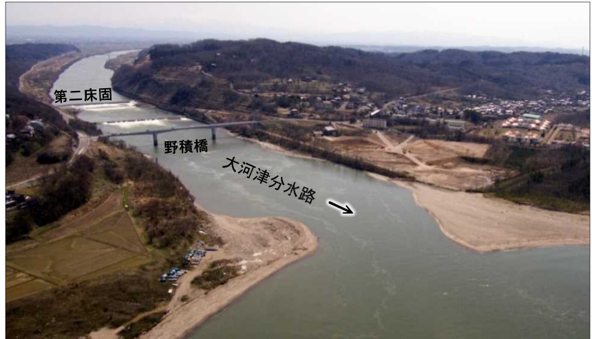
写真 平成29年4月撮影